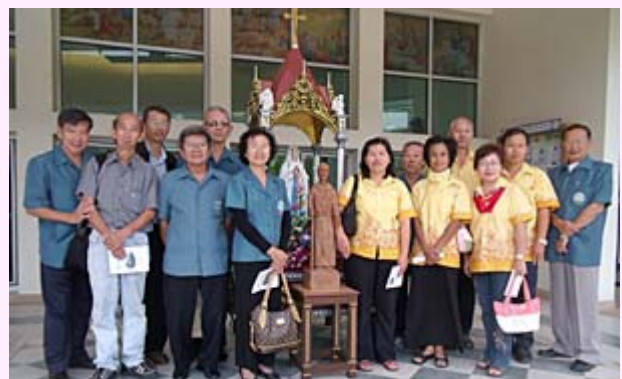
9 พฤศจิกายน 2010 เซอร์ราบ้านโป่งเชิญรูปนุญราศี สุนิเปโร เซอร์รา มาส่งมอบให้เซอร์ราบางแสน ที่วัดบางแสน