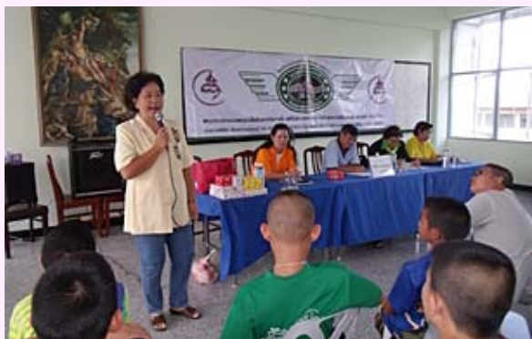
20-24 ต.ค. 2010 คณะเซอร์ราสังฆมณฑลจันทบุรี ร่วมจัดงานค่ายกระแสรักบ้านเกิดพระหฤทัย ศรีราชา