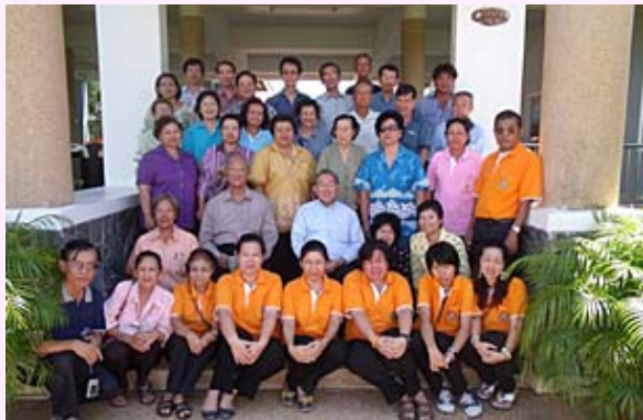
25-26 กันยายน 2010 คณะเซอร์ราสังฆมณฑลจันทบุรี จัดอบรมฟื้นฟูจิตใจ ณ บ้านสแตนลามาริส บ้านเพ ระยอง