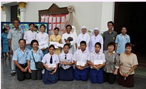
21 พฤศจิกายน 2010 คณะเซอร์ราอัครสังฆมณฑลกรุงเทพฯ จัดกิจกรรมส่งเสริมกระแสรักที่วัดนักบุญยอแซฟ ตรีทองจันทน์