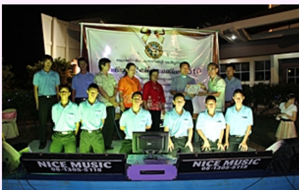
28 พ.ย. 2010 เซอร์ราบางแสนจัดงานหารายได้สมทบกองทุนกระแสรัก และงานสมโภช 75 ปี บ้านเนรพระหฤทัย ศรีราชา